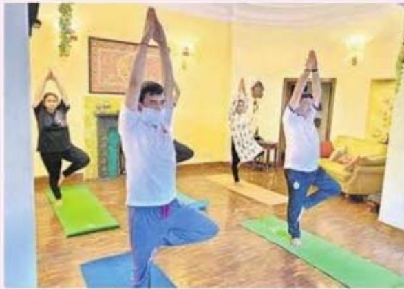
కుటుంబ సభ్యులతో యోగాసనంలో పెట్రోలియం శాఖ మంత్రి ధర్మేంద్ర ప్రధాన్

భువనేశ్వర్/ఖుర్దారోడ్: అంతర్జాతీయ యోగా దినోత్సవం పురస్కరించుకుని, ఇంటిల్లపాది యోగాసనాలతో హడావిడిలో మునిగారు. కరోనా నేపథ్యంలో ఇంటి ఆవరణలో కుటుంబీకులంకా యోగాసనాలు వేస్తూ కాలం గడిపారు. రాజకీయ ప్రముఖులు, ఉన్నతాధికారులు, విద్యార్థులు, ఉద్యోగులంతా క్లిష్టమైన ఆసనాలతో ఆరోగ్య సాధనకు శ్రీకారం చుట్టడం విశేషం.