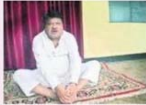
ఎంపీ జ్యయోల్ ఓరాం యోగాసనం